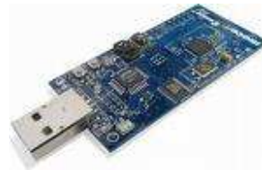
Figura 2. Mote TMote-Sky. Nodo sensor de la Red, se basan en una arquitectura compatible con telos-b

componentes que proporciona a los nodos sensores todo el soporte de comunicaciones, gestión de memoria y planificación de tareas (tales como adquisición, temporización, etc.) permitiendo al diseñador la abstracción del hardware del sensor. El proyecto está desarrollado por un consorcio liderado por la Universidad de Berkeley en California, en cooperación con Intel Research.