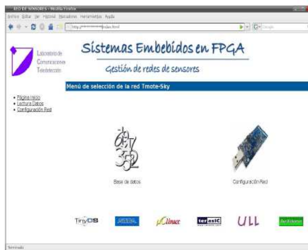
Figura 3. Diagrama de bloques del sistema implementado

Aunque como comentamos anteriormente la entrada de configuración básicamente es utilizada para configurar los nodos de la red. Lo importante a destacar de esta aplicación es que se ha implementando de tal forma que proporcione el enlace o canal de comunicación necesario entre el sistema empotrado y el nodo gateway independientemente de la aplicación y de las características de la red.